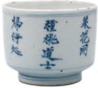
染付漢詩茶碗 [前期展示]