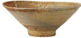
本手蕎麦茶碗 銘 藤浪 [後期展示]