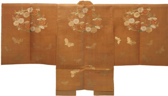
鴉地梅蝶紋長絹 [前期展示]