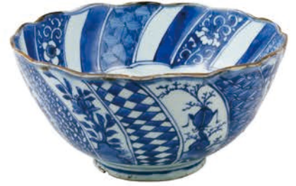
祥瑞二段捻鉢 [後期展示]