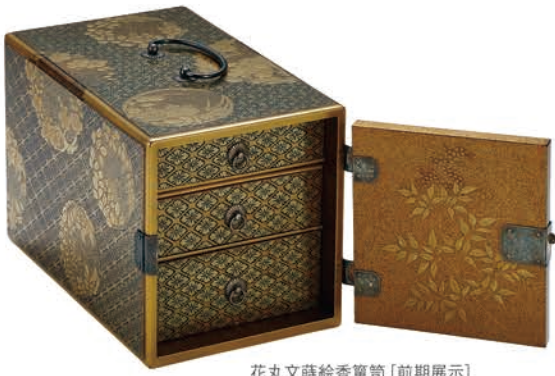
花丸文蒔絵香篋箱 [前期展示]