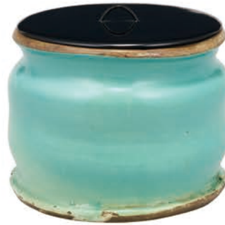
和蘭陀青釉水指 [後期展示]