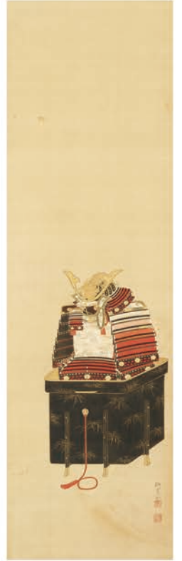
田中訥言筆 鍔鍔図 [後期展示]