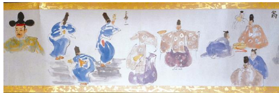
太田喜二郎筆 碧雲荘舞台披絵巻物